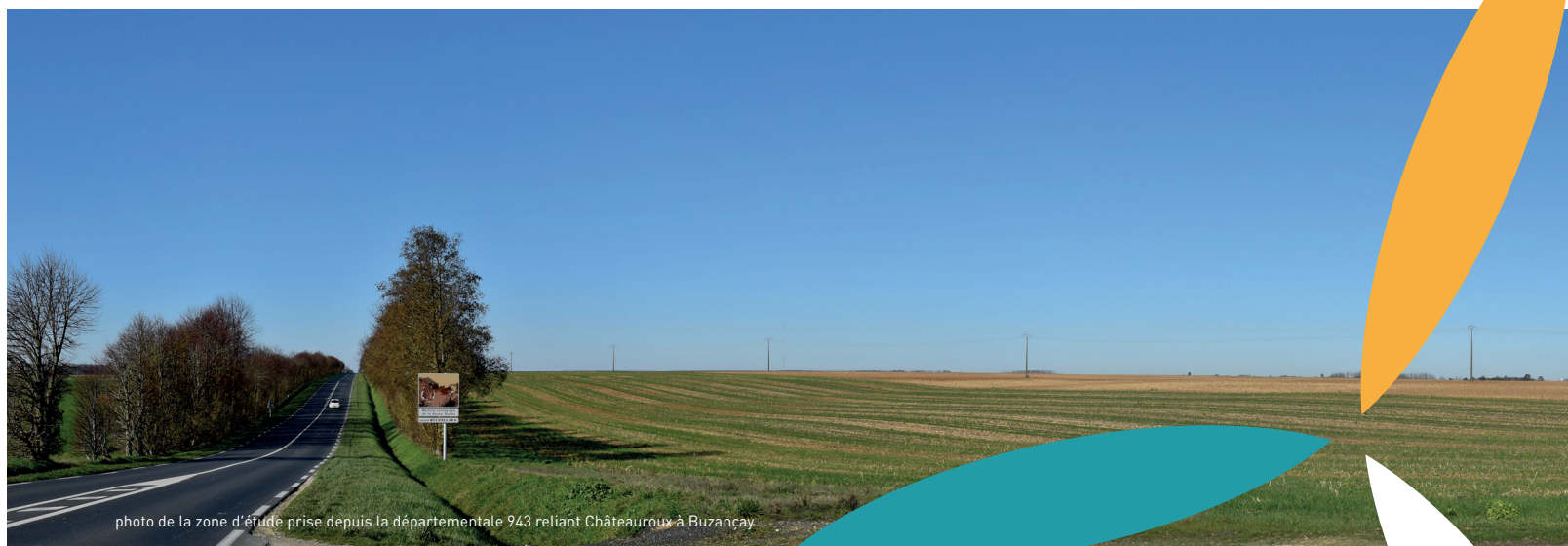
photo de la zone d'étude prise depuis la départementale 943 reliant Châteauroux à Buzancy

1100 MW raccordés en Centre-Val de Loire